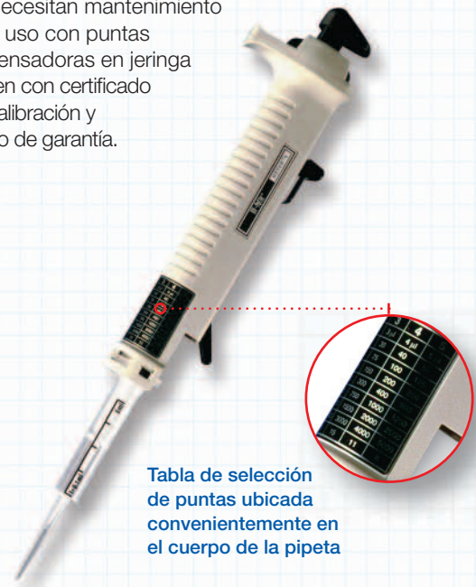
Tabla de selección de puntas ubicada convenientemente en el cuerpo de la pipeta